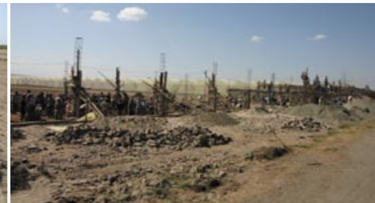
Dagelijks werken zo'n 1.300 mensen in de bouw. Hier worden funderingen gelegd.