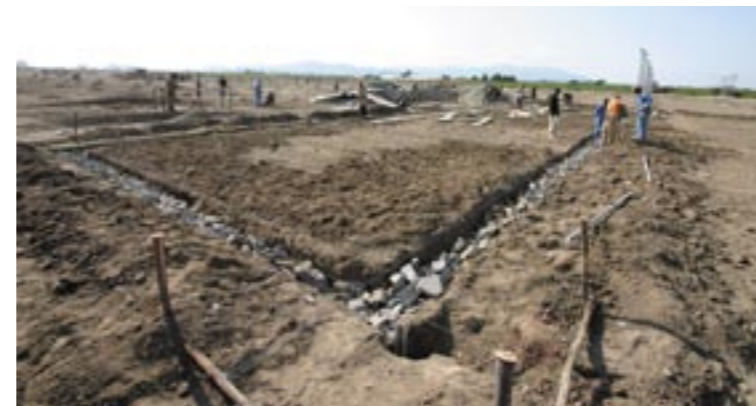
In totaal beslaat het terrein van Sher 300 ha.

De regering realiseerde zich dat een productie-grootte van enkele honderden hectares productie noodzakelijk is om een bloemenland van betekenis te kunnen worden. Dat is namelijk de kritische grootte die nodig is om interessant te zijn voor toeleveranciers en voor luchtvaartmaatschappijen om bloemen op te pikken. Als die er eenmaal zijn, zal de groei zich min of meer vanzelf doorzetten.