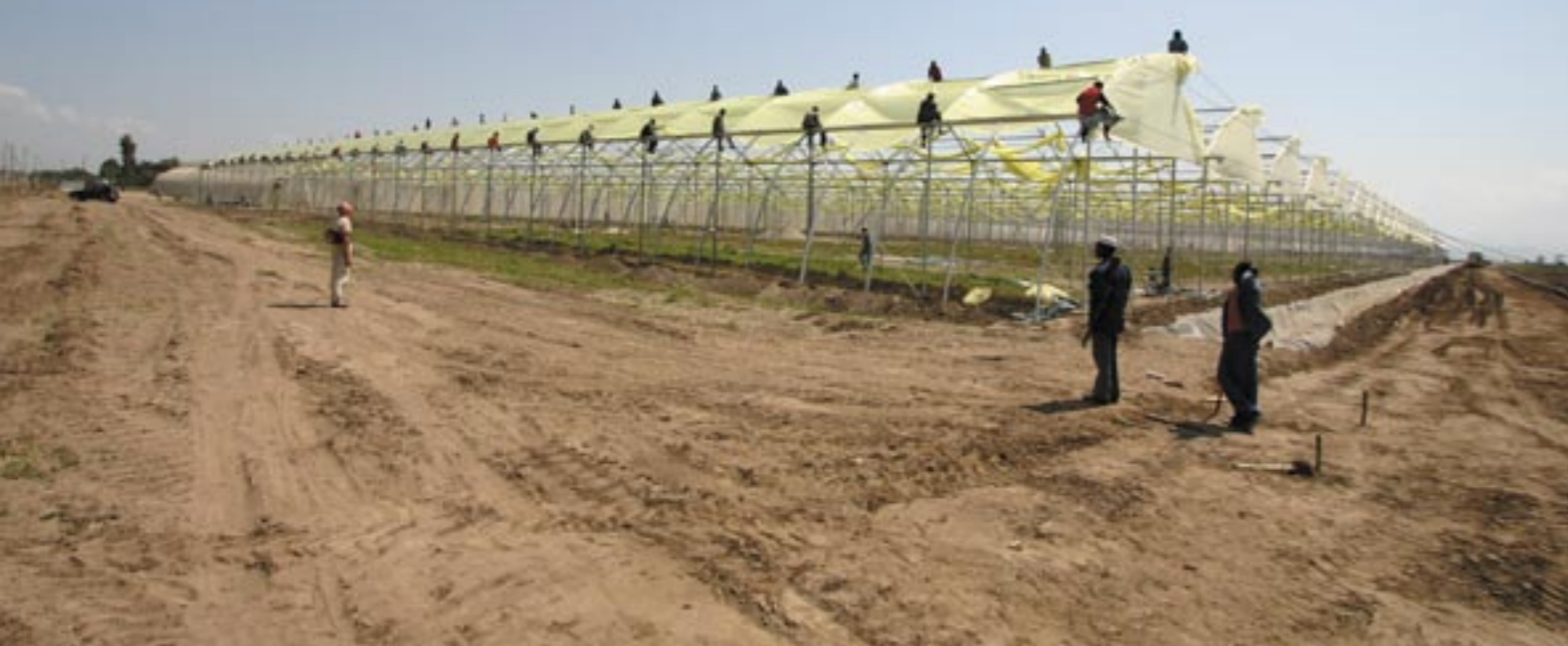
Op elke paal zit een werknemer om het plastic folie over de kap te spannen.

Begin juni dit jaar startte Sher met de bouw van een sierteelproject in Ethiopië. Niet om zelf bloemen te telen, maar om volledig ingerichte bedrijven te verhuren. Over een paar weken worden de eerste rozen al gesneden.